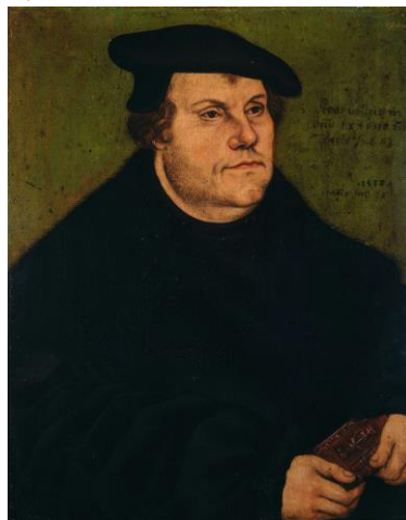
d) “Abbild Martin Luthers”